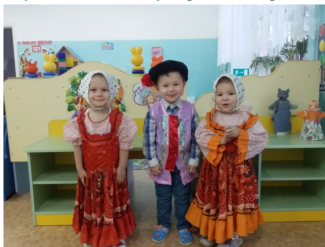
МДОУ ИДС «Колосок»