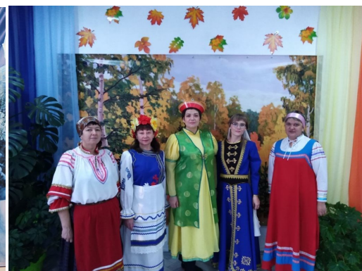
МДОУ «Турунтаевский ЦРР-ДС»